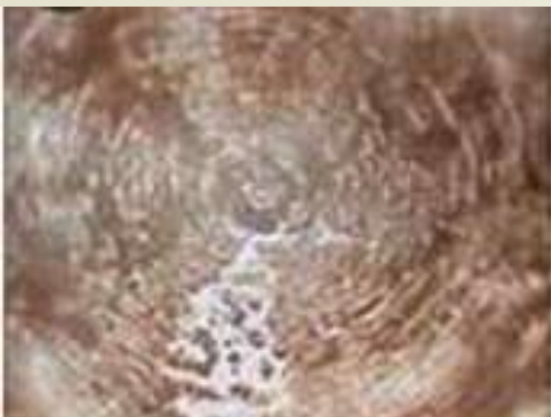
Тяжелый металлический рок