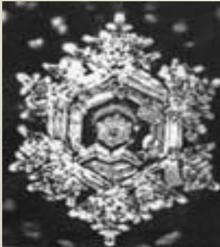
Вода после молитвы