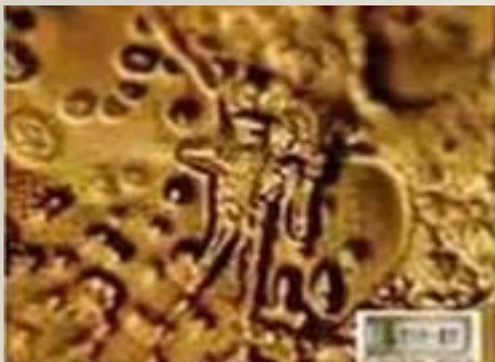
«Ты надоел мне. Я убью тебя»