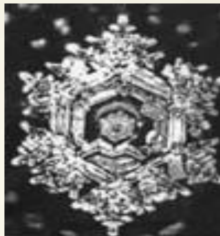
Вода после молитвы